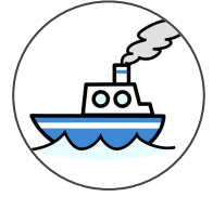
bateau funé 船