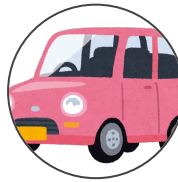
automobile jidousha 自動車