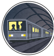
métro chikatetsu 地下鉄