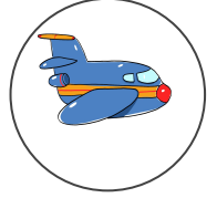
avion hikouki 飛行機