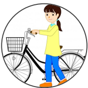
bicyclette jitensha 自転車