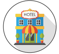
hôtel hoteru ホテル