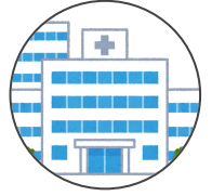
hôpital byōin 病院