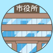
Hôtel de ville shiyakusho 市役所