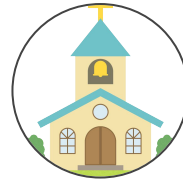
église kyōkai 教会