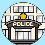
commissariat de police keisatsusho 警察署