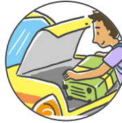
taxi takushī タクシー

Je voudrais aller à ~ ~ e ikitai no desu ga. ~ へいきたいのですが。