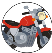
moto ootobai オートバイ