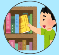
bibliothèque toshokan 図書館