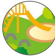
parc kōen 公園

Je voudrais aller à ~ ~ e ikitai no desu ga. ~ へいきたいのですが。