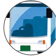
bus basu バス