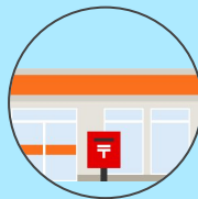
bureau de poste yūbinkyoku 郵便局